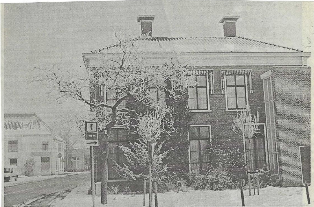
Opname in 1999 van het gebouw 'Nijenstein' (thans in gebruik als muziekschool) aan de Voorstraat te Buitenpost. Deed van 1892 tot 1977 dienst als gemeentehuis